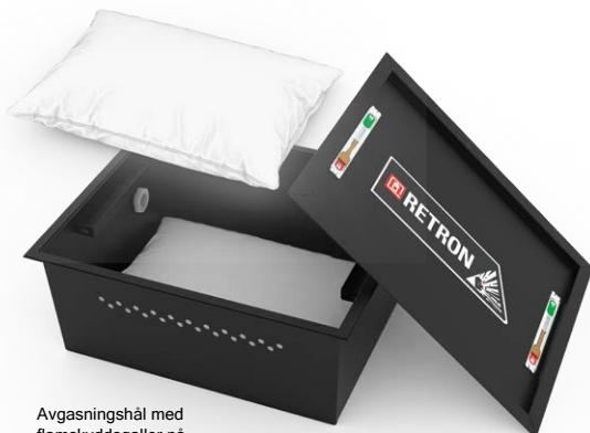
Avgasningshål med flamskyddsgaller på baksidan

En utförlig bruksanvisning finns på www.esec.com